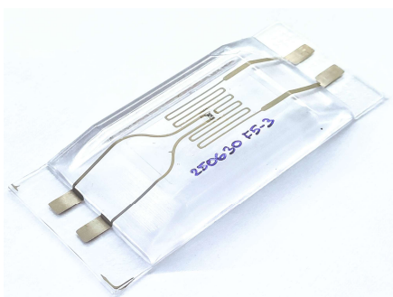
Obr. 1: Strukturální elektronický prvek na bázi polykarbonátu realizovaný kombinací termoformování a vstřík lisování s plně objemově integrovaným topným odporovým elementem a termistorem pro zpětnovazební měření teploty.

Strukturální interiérový prvek s integrovaným elektrickým ohřevem a zpětnovazebním měřením teploty pro dopravní techniku