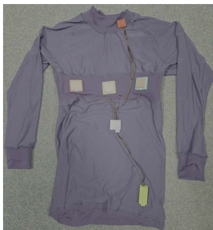
Obr. 1: Vnitřní subsystém MOSENZ.

Modulární multisenzorický profesní oděv k řízení rizika, ochraně zdraví a bezpečnosti členů IZS pomocí metod umělé inteligence