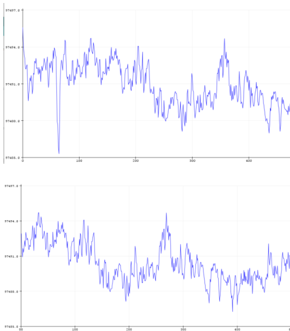
Obr. 2. Časový průběh atmosférického tlaku