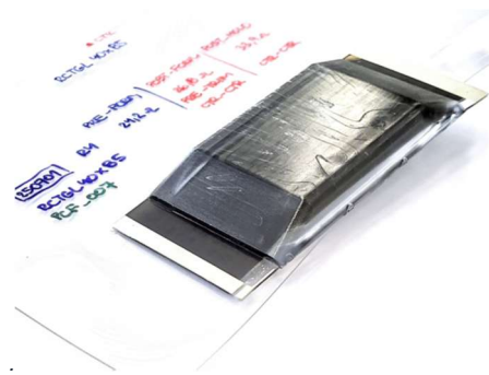
Obr. 2: Vodivý strukturální prvek na bázi CNT realizovaný procesem termoformování a vstřikolisování PC.