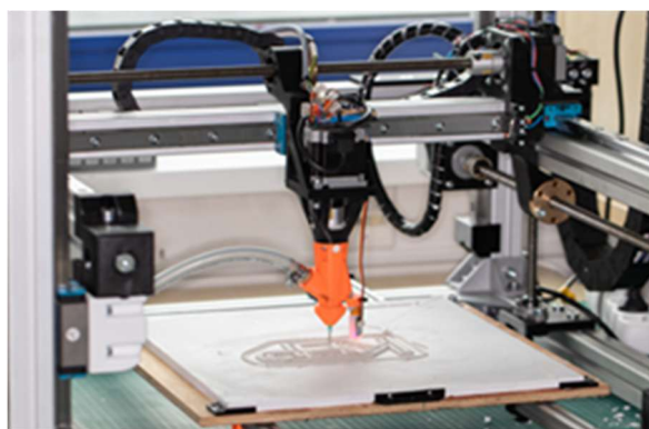
Tisková hlava využívající šroubovicový dávkovací systém